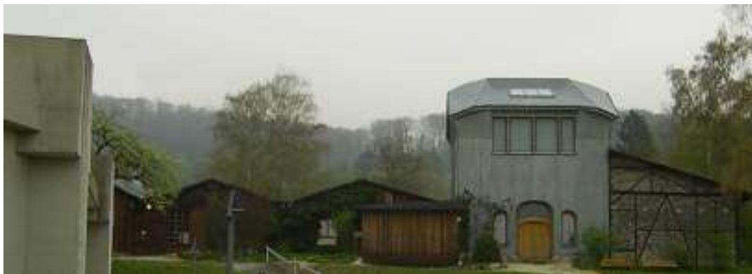
La Menuiserie et l'Atelier

A Dornach, lorsqu'on parle de « La Menuiserie » [Die Schreinerei], on évoque le lieu, situé juste derrière le Goethéanum [emplacement ③ sur le plan, et ② pour l'Atelier où Steiner sculpta le « Groupe »] qui sert de menuiserie lors de la construction du Premier Goethéanum (Johannesbau), qui sert ensuite de refuge après l'incendie de la Saint-Sylvestre 1922/23, et où eurent donc lieu de nombreuses conférences de Steiner en 1923 et 1924.