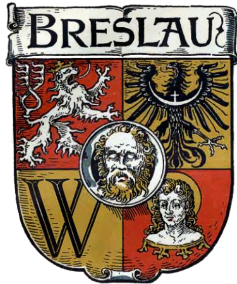
Stemmi di Breslau (Breslavia)

Sigillo medieval degli Skene di Skene [Johan of Skene, XIIIe-XIVe siècles] [William Forbes Skene, Ed., Memorials of the Family Skene of Skene, Aberdeen, 1887] https://archive.org/stream/memorialsoffamil00skenuoft#page/n37/mode/2up